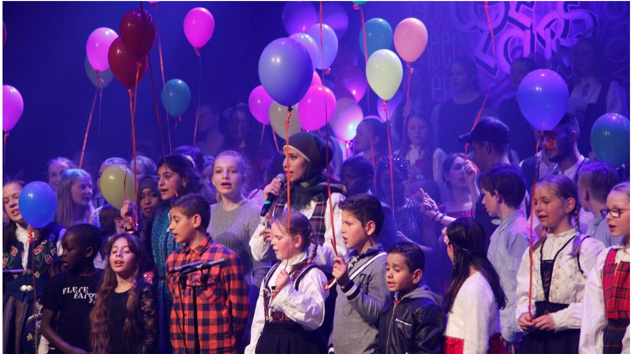
Flere farger 2019.