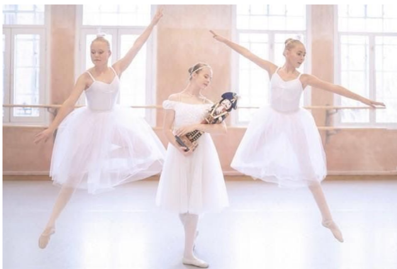
Fra Svanesjøen Ballettskole og Nøtteknekkeren.

Dans, både for amatører og profesjonelle, krever gode fasiliteter. Uten tilrettelagte arbeidsmiljøer, slik som gode gulv som forebygger skader, er det ikke forsvarlig å bedrive profesjonell undervisning eller trening.