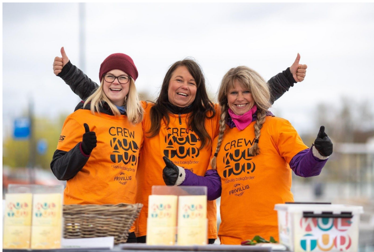
Frivillighet: Fra KUL-TUR (tidl. Frivilligdagen) 2019.

likemannsarbeid, idrettsforeninger, jazzklubber, eller letemannskap og førstehjelp, så sitter frivillige på uvurderlig kunnskap og erfaring. Disse ressursene er en avgjørende del av samfunnets grunnmur, de bærer oss gjennom kriser, og bidrar til å skape glede og trygghet lokalt.