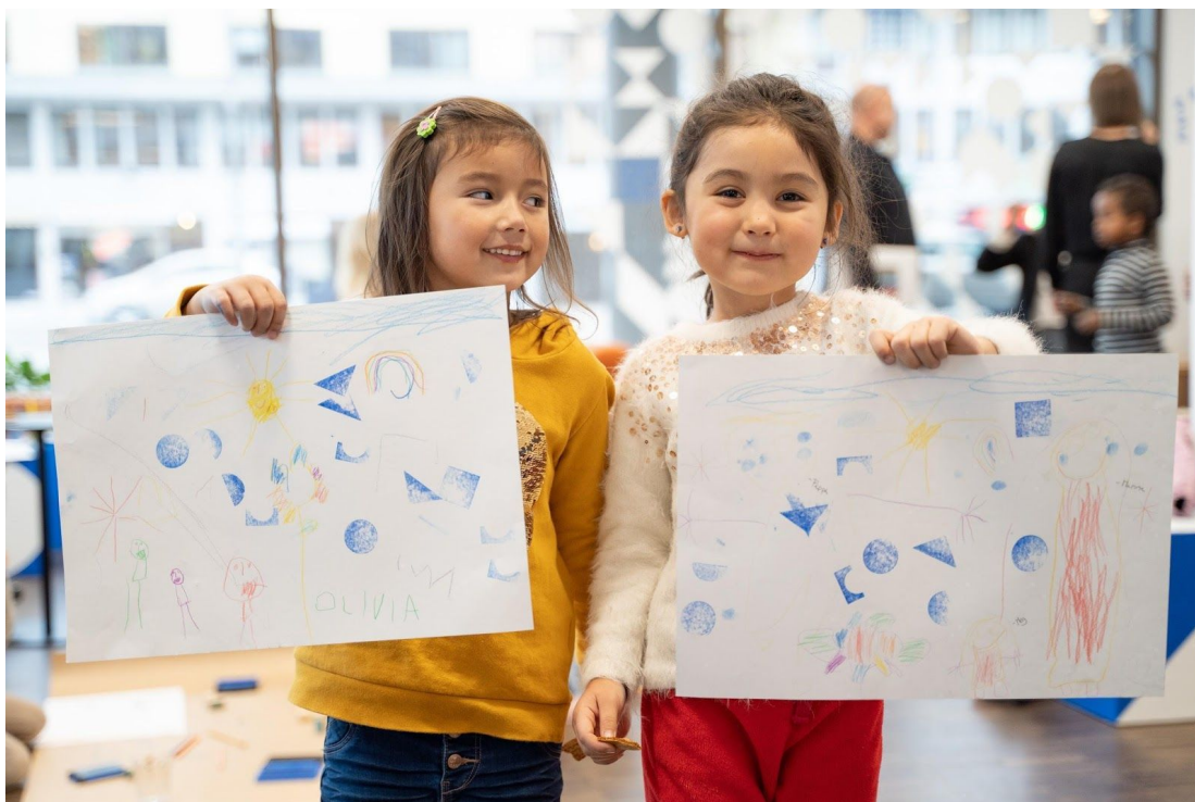
Fra kultur-workshop.

Gjøvik kommune vil se på muligheten for å utvikle Den kulturelle bæremeisen (DKB), en ordning for barnehagebarna. Slik får også de minste gode kunstmøter som er både kunstfaglig og barnefaglig tilrettelagt, og med barna både som medskapere, deltagere og publikum.