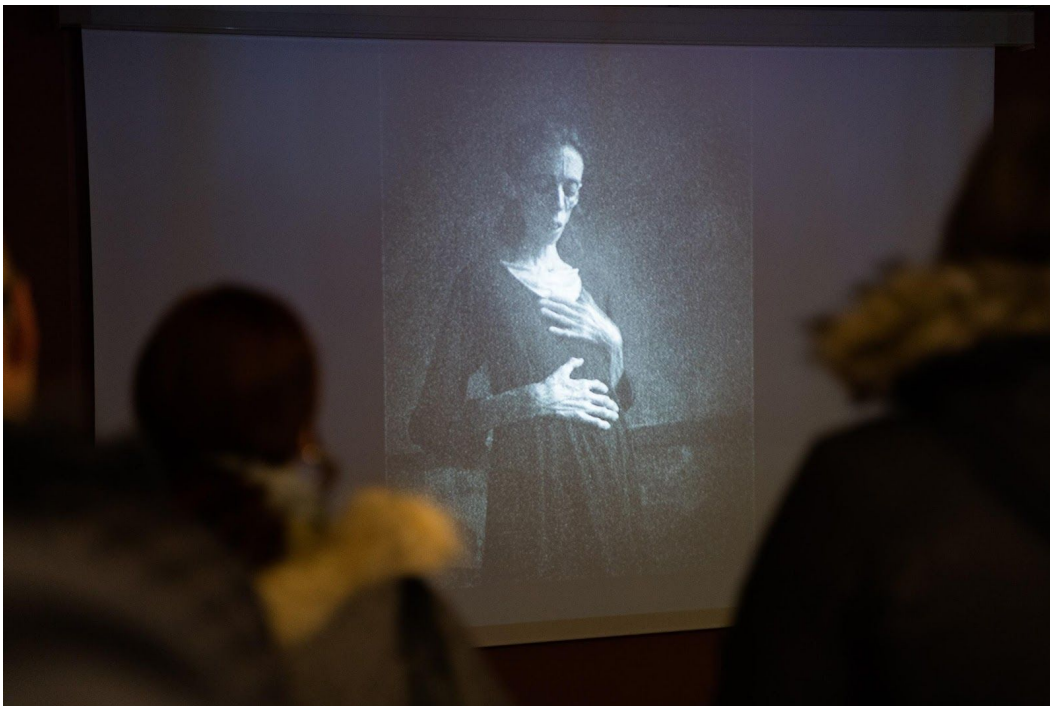
Premiere på filmen "Selvportrett" av Margreth Olin.

Gjøvik kino er en av de eldste kommunale kinematografene i landet. Kinoen ble åpnet i Arbeidersamfunnet i 1914 og viste stumfilmer akkompagnert av piano. I 1958 flyttet kinoen til sine nåværende lokaler i Strandgata . Dagens kinotilbud har vært en integrert del av kulturhusdriften siden 2011. Hele Gjøvikregionen benytter seg av tilbudene på Gjøvik Kino , og kinoen har fremdeles svært gode besøkstall om vi sammenligner med landet forøvrig.