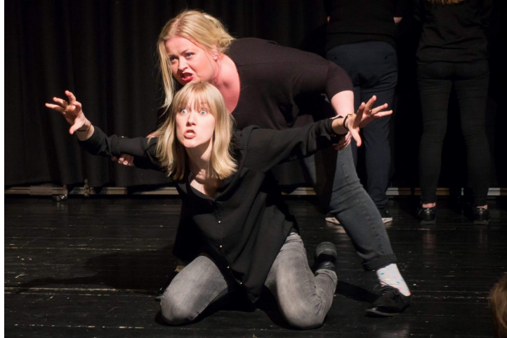
Improvisasjonskollektivet Norsk Sceneskredd

Attraktive arbeidsmiljøer for scenekunstnere vil øke kvaliteten og bidra til at det utvikles flere og bedre scenekunstproduksjoner i kommunen. Rekruttering av både fagarbeidere og elever foregår primært via jungeltelegraf og omdømme, og profesjonelle arbeidslokaler tiltrekker seg gode pedagoger og dansekunstnere, og motiverer elevene.