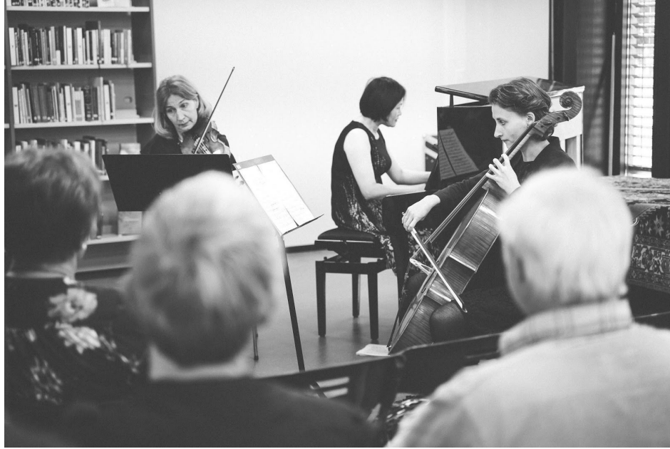
Gjøvik Trio på Gjøvik bibliotek og litteraturhus