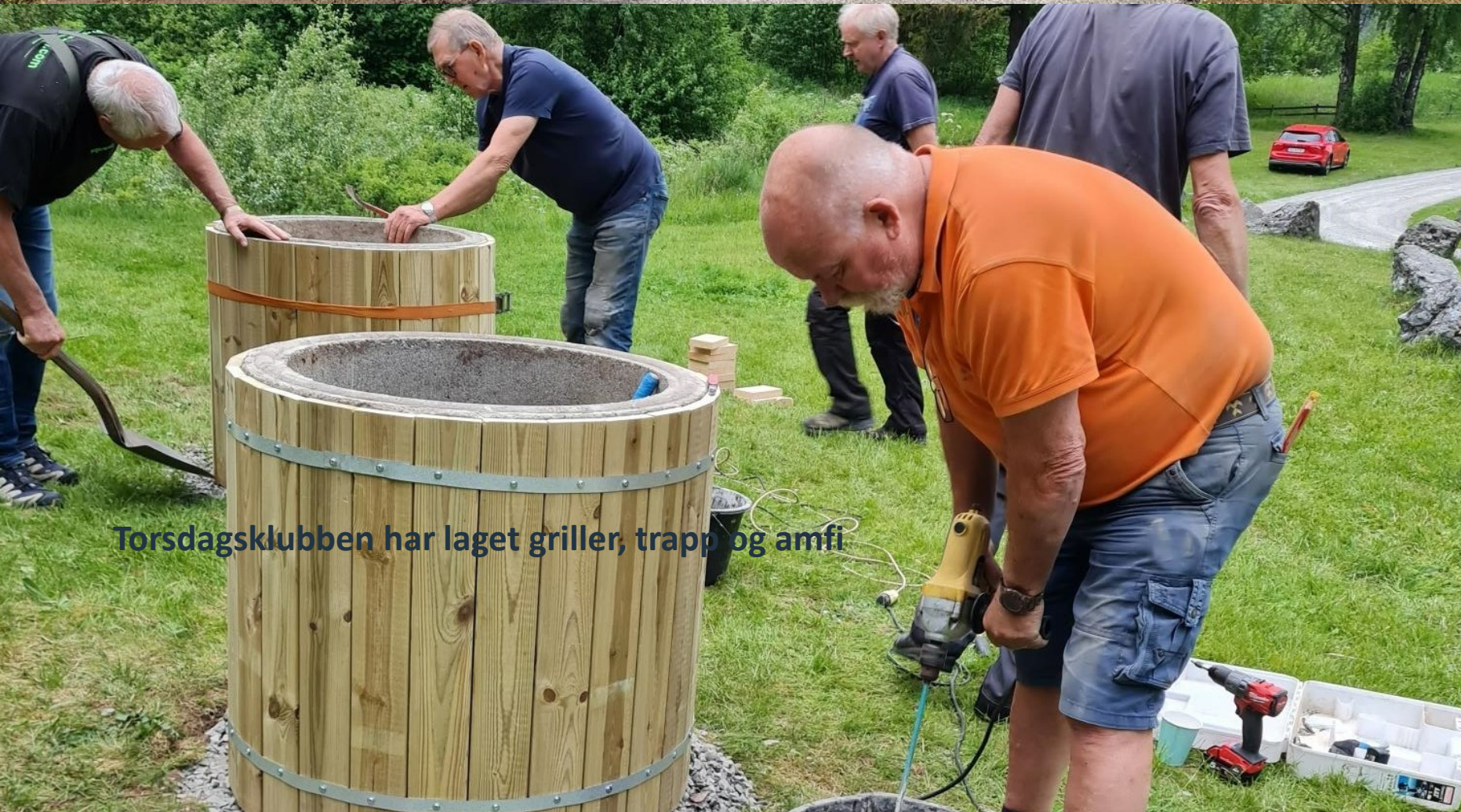
Torsdagsklubben har laget griller, trapp og amfi

Veg, opprydning, vegetasjon, sandvolleyballbane, badebrygge med stuperårn, skilting, griller, termometer, trapp og amfi