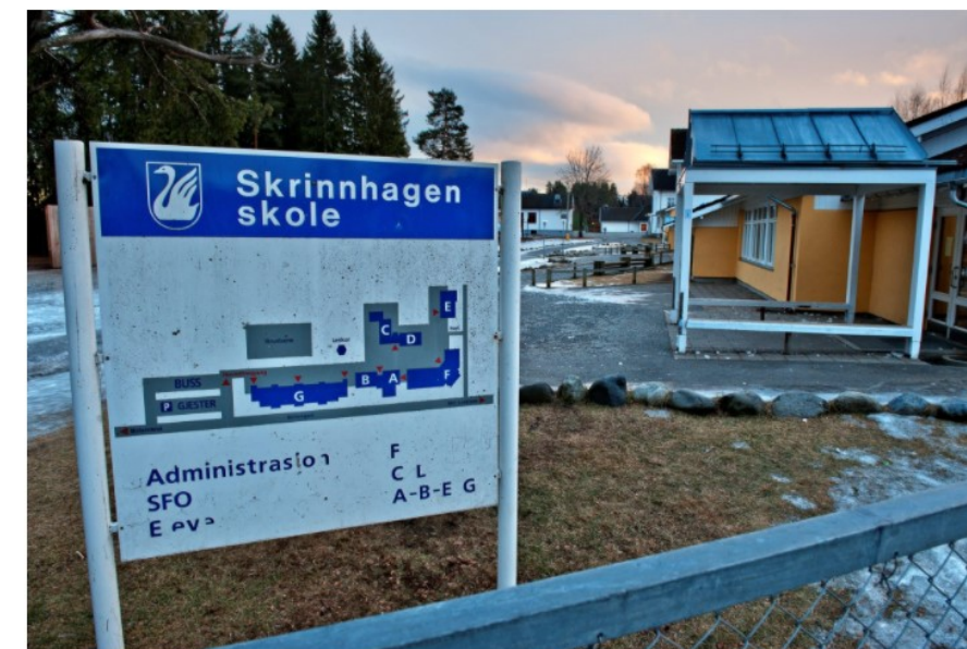
NY SKOLE: Ungene på Biri skal få ny skole å gå på. Området til Skrinshagen skole blir da ledig.