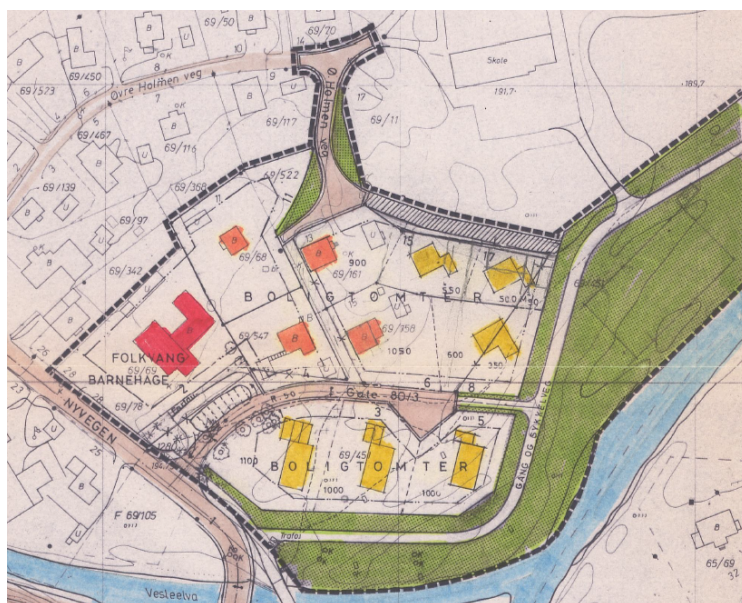
Figur 1. Reguleringsplan for Folkvang-Hunndalen (plan-id 05030103)